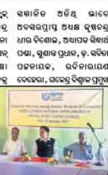
କଳିଙ୍ଗ ନୂଆ ଶିକ୍ଷା ସମ୍ପର୍କରେ ଆଲୋଚନା ହେଉଥିବା ଦୃଶ୍ୟ।